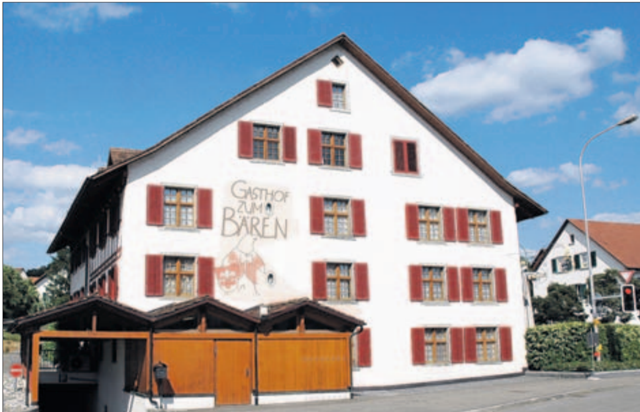
Aus dem Gasthof zum Bären soll ein kommunales Dienstleistungszentrum für das Alter werden. (A)

Der Kaufvertrag für den «Bären» wird der Gemeindeversammlung vom 22. November unterbreitet. Gleichzeitig sollen die Stimmbürger auch über den für den Umbau des Gebäudes notwendigen Kredit befinden. Wie hoch dieser sein wird, ist noch offen, da das Projekt und der Kostenvoranschlag noch in Bearbeitung sind. «Wir arbeiten mit Hochdruck daran», erklärt Gemeindepräsident Franz Brunner. Geplant ist zum einen der Betrieb eines öffentlichen Restaurants mit 60 Sitzplätzen. Im ehemaligen Hotelbereich soll das Dienstleistungszentrum eingerichtet werden. Dieses soll nach dem Willen des Gemeindevorstandes